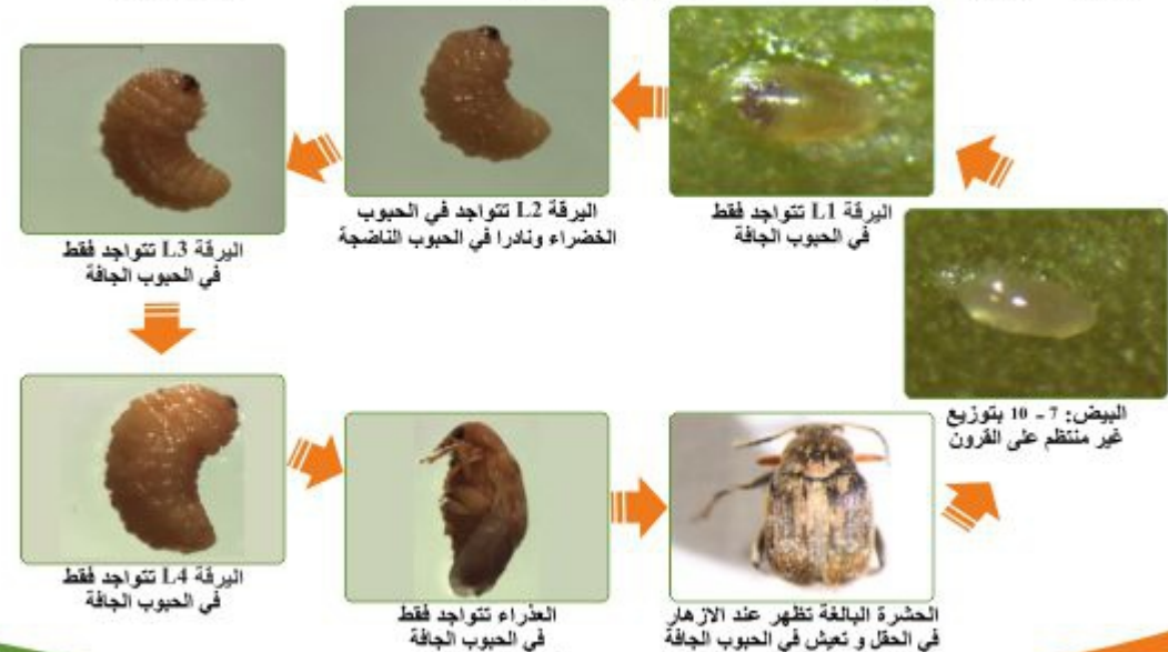
الرسم 4: الدورة الحياتية لخنفساء القول