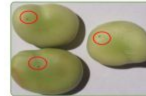
الرسم 2: اثار دخول اليرقة داخل حبات القول