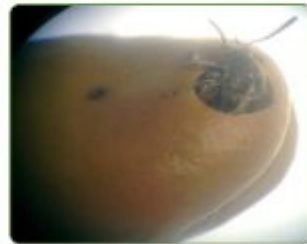
الرسم 5: أضرار خنفساء القول الكبيرة على القول المصري (1) والقول الكبير (2)