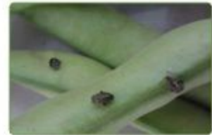
الرسم 1: الأنثى أثناء وضع البيض على قرون القول