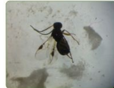
الرسم 6: الطفيل Sigalphus thoracicus

Zelus renardii و Pediculoïdes ventricosus